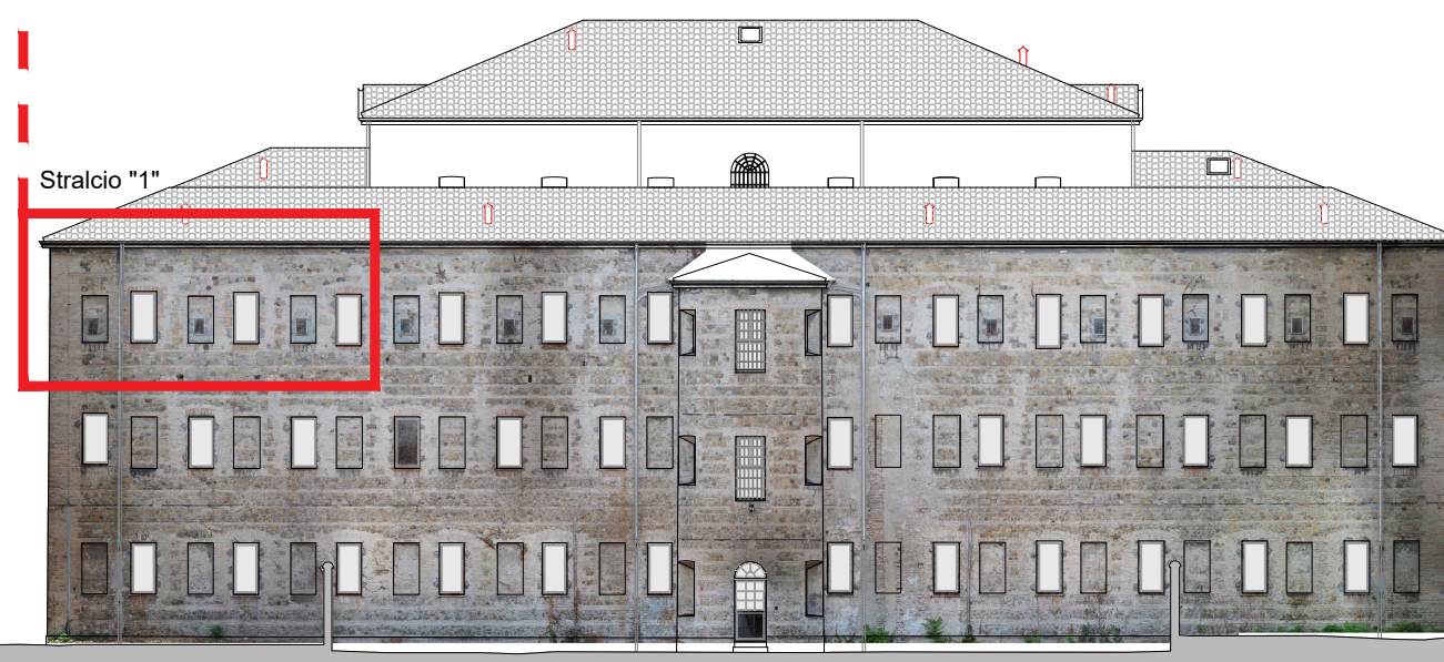
EDIFICIO ESISTENTE - PROSPETTO NORD

Art. 3.2.31 (Comma 6) Per gli edifici soggetti a "restauro scientifico" e a "restauro e risanamento conservativo", nei confronti dei quali l'impossibilità di aprire nuove aperture nei prospetti o la presenza di portici o logge impediscano il corretto raggiungimento del rapporto illuminante pari a 1/8, è ammesso il mantenimento del rapporto illuminante in essere o il suo miglioramento, anche in caso di cambio di destinazione d'uso, alla condizione che la superficie in oggetto, in sede di primo accatastamento, costituisca superficie utile (sono quindi esclusi i recuperi di superficie utile di locali pertinenziali, quali ad esempio magazzino, deposito, cantina, rimessa). E' invece ammesso il recupero di locali pertinenziali per gli usi commerciali e terziari, nel rispetto dei requisiti prestazionali relativi ai luoghi di lavoro.