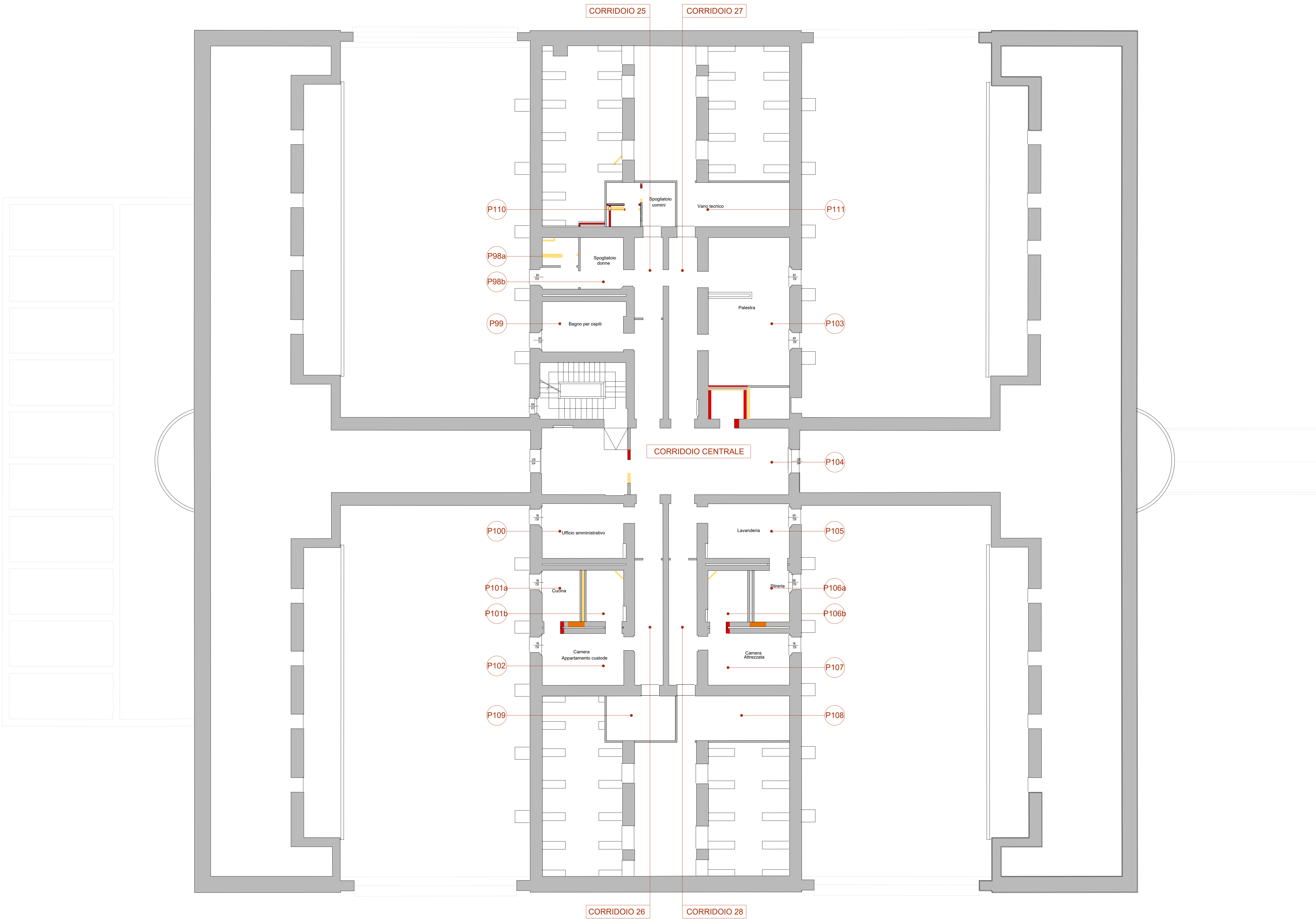
PIANTA PIANO TERZO +13.24 (Sottotetti a quota variabile)